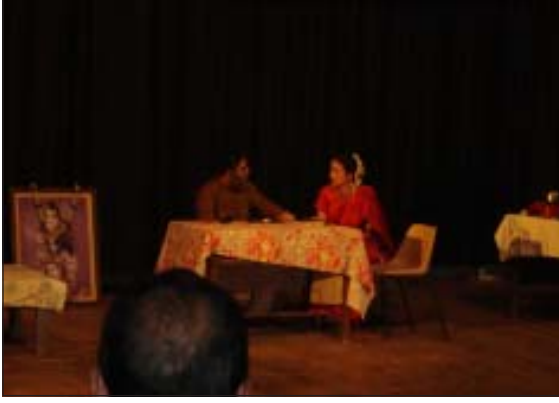
सांस्कृतिक कार्यक्रम की एक झलक