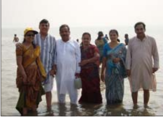
गंगा सागर तट पर लहरों का आनन्द लेते कुछ भार्गव बन्धु