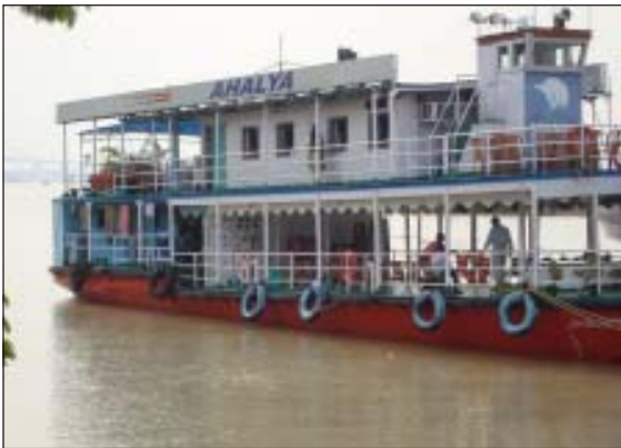
भार्गव बन्धुओं को गंगा विचरण हेतु ले जाने को तैयार क्रूज