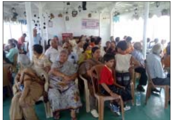
क्रूज द्वारा गंगा विचरण का आनन्द