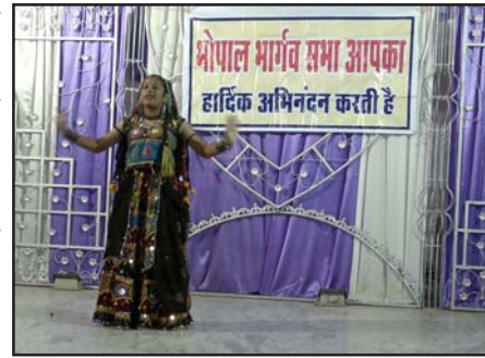
सांस्कृतिक कार्यक्रम की एक झलक