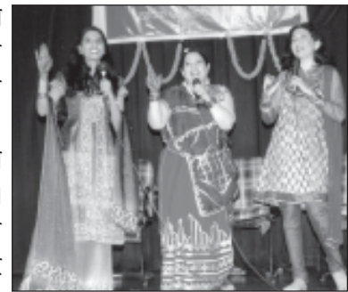
कार्यक्रम की एक झलक