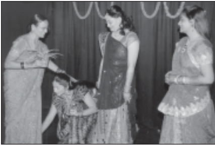
अध्यक्षा द्वारा नवविवाहितों का समान

पूर्व अध्यक्षाओं, अध्यक्ष, मंत्राणी द्वारा दीप प्रज्वलन किया गया व दिल्ली भार्गव सभा के अध्यक्ष, सचिव, अखिल भारतीय युवा संघ के सचिव, दिल्ली युवा संघ के अध्यक्ष व सचिव व विशेष आमंत्रित सदस्यों द्वारा हमारे पूर्वजों के चित्रों पर पुष्प अर्पण किया गया।