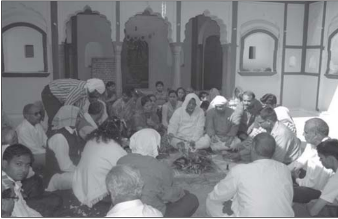
भण्डारे के अवसर पर मन्दिर प्रांगण में सम्पन्न हवन

एवं सराहनीय कार्य रहा है, उनकी इस निस्वार्थ सेवा के लिए सभी सदस्यों ने उनको धन्यवाद दिया।