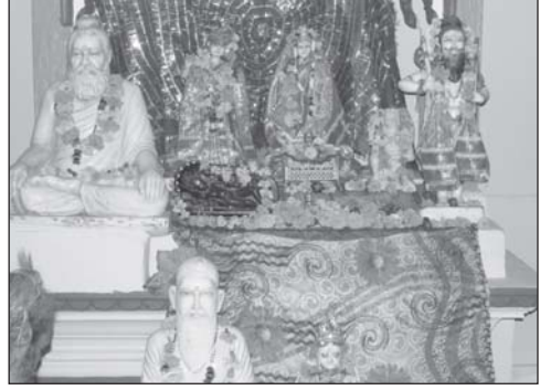
ढोसी पर्वत स्थित महर्षि च्यवन मन्दिर में स्थापित प्रतिमायें

मन्दिर तक पहुँचने के लिए ठीक कराये गये कच्चे रास्ते से इस वर्ष 70 वर्ष से ऊपर के सदस्य भी आसानी से मन्दिर