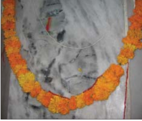
संगमरमर पर स्वयं उभरी हनुमान जी की आकृति