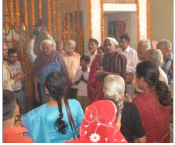
प्राण प्रतिष्ठा समारोह पर भक्तजन